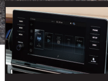
Centro de entretenimiento de 9" con CarPlay y Android Auto