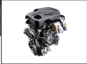
Motor TURBO 1.5L gasolina 160 HP y 280 NM