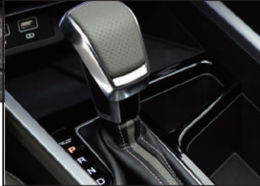
Caja de 6 velocidades con modos: Normal, Sport y Winter