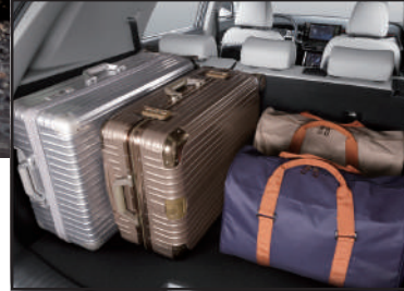
Capacidad de baúl 703 Litros