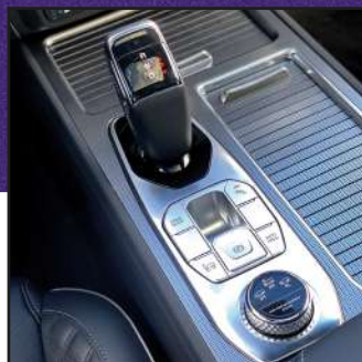
4x4 con bajo Transmisión electrónica Shift By Wire con 8 velocidades