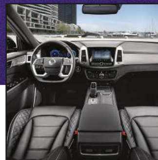
Centro de entretenimiento de 9" con Carplay & Android Auto