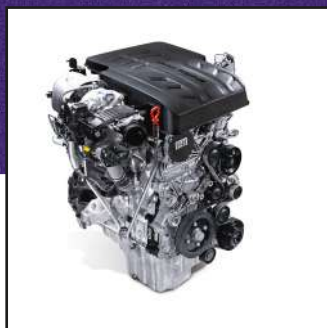
Motor 2.2 Turbo Diésel con 200 HP y 441 NM