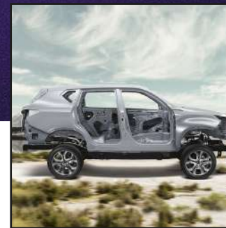
Máxima seguridad Chasis reforzado, 6 airbags, hasta 15 asistencias de seguridad.