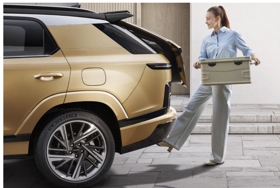
APERTURA ELÉCTRICA DE BAÚL CON FUNCIÓN "HANDS FREE"

CALEFACCIÓN Y ENFRIAMIENTO EN ASIENTOS DELANTEROS. CALEFACCIÓN EN ASIENTOS DE LA SEGUNDA FILA.